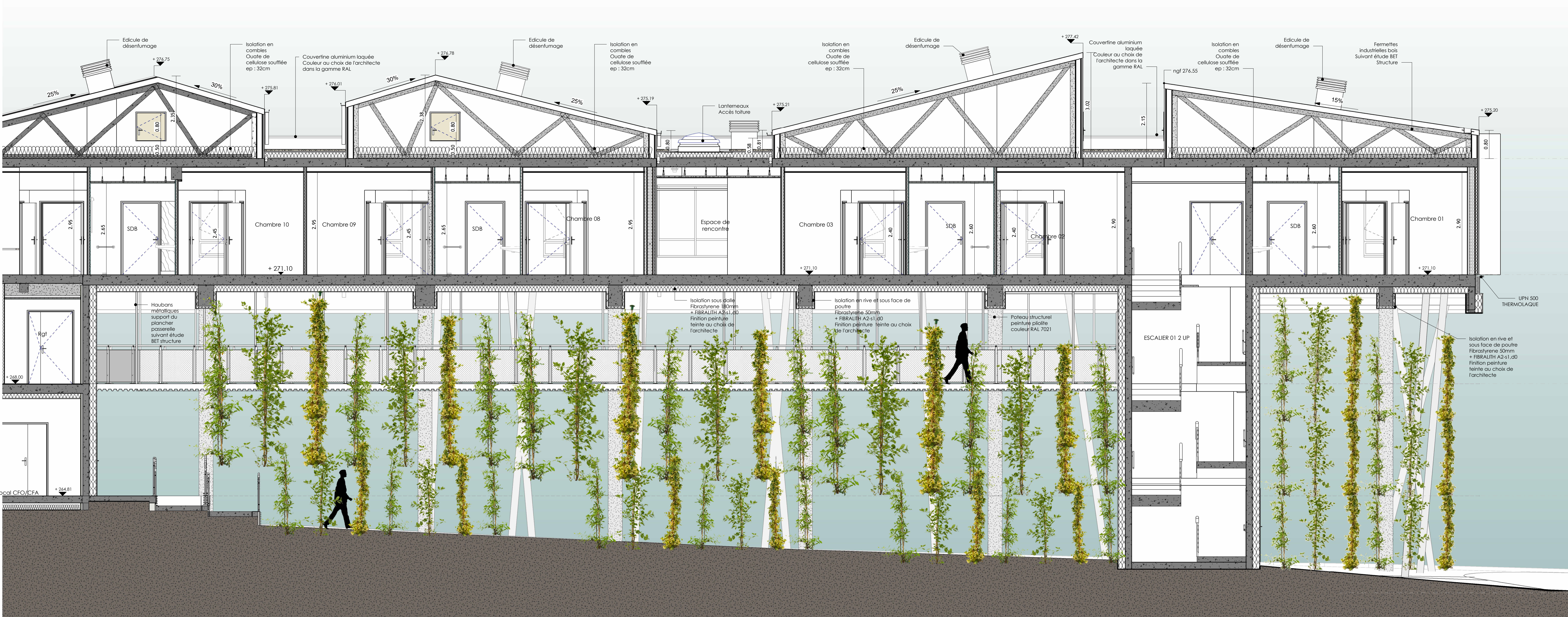
02_06_LIV_LONGITUDINALE-ZONE OUEST ECH. : 1 : 50